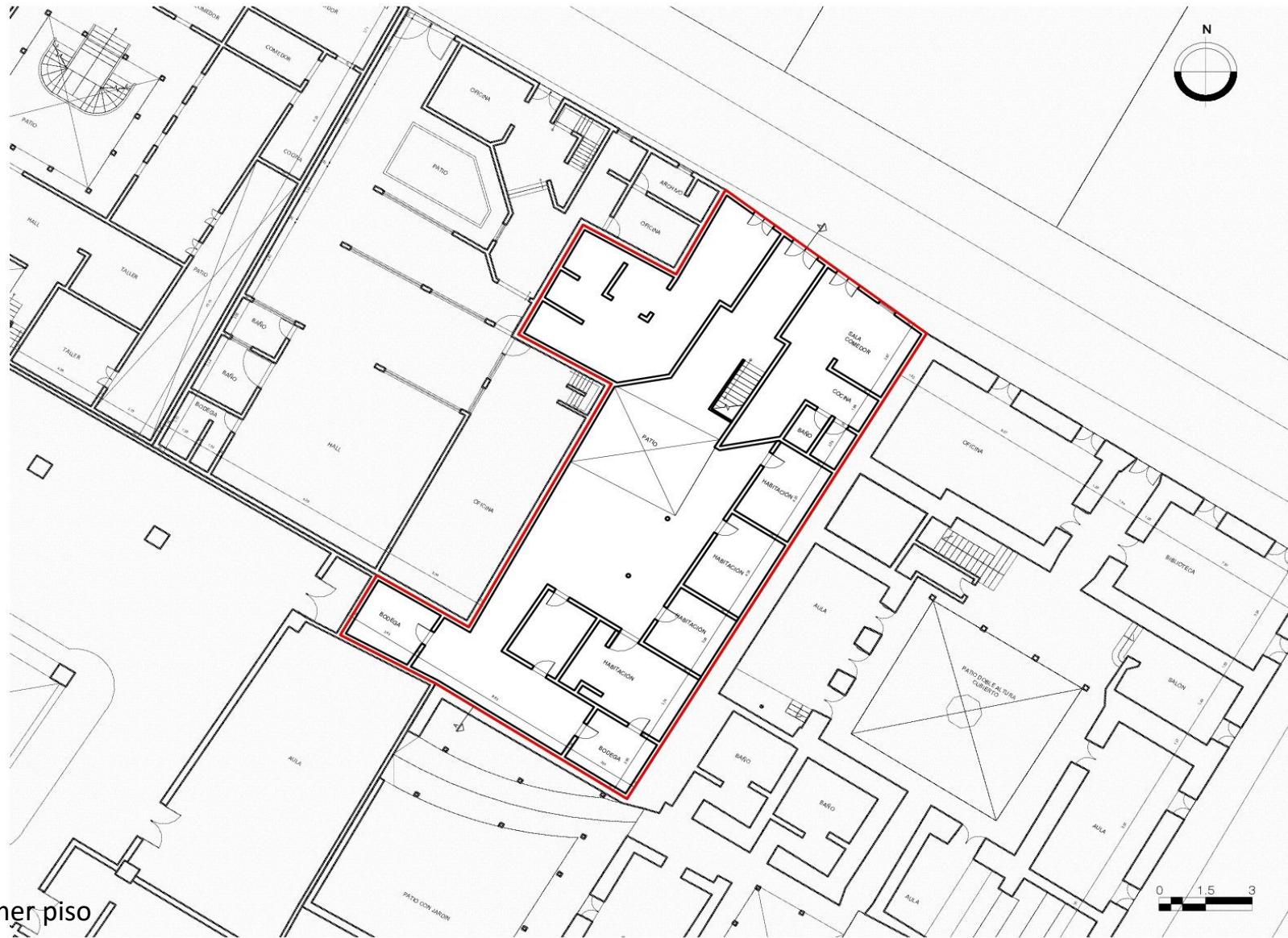
Planta primer piso